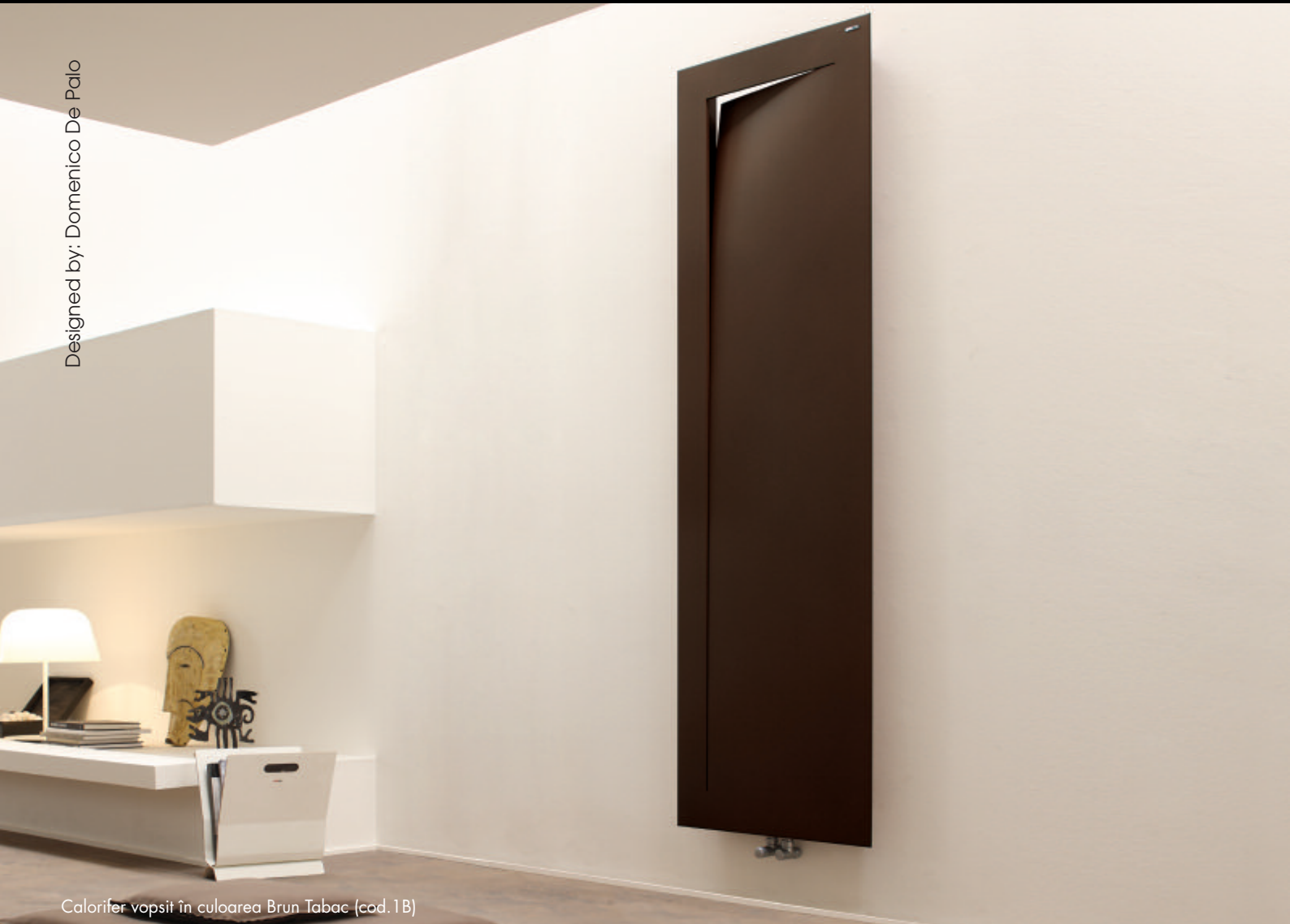
Calorifer vopsit în culoarea Brun Tabac (cod. 1B)