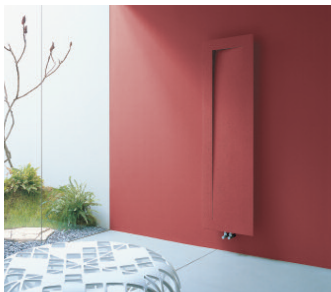
Calorifer Wall finished (cod. 6B)

Corpul radiant este o sculptură murală și oferă infinite soluții de amenajare. Iar mimetizarea finisajelor creează un anturaj cu adevărat armonios. Linia nu este scopul în sine, ea dă naștere formei care devine corp, lumină, culoare, pentru a se transforma mai apoi în căldura.