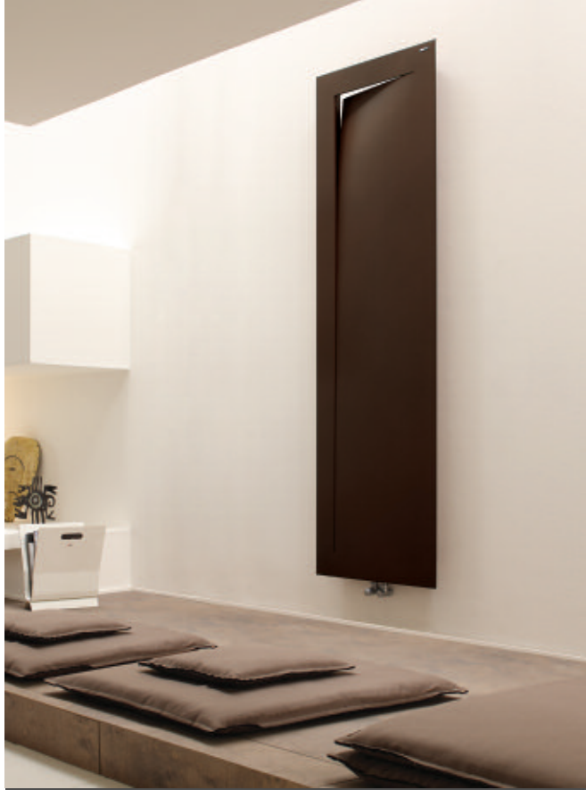
În fotografie: Calorifer Immagina L. Înălțime mm 2000, lățime mm 600, culoare Brun Tabac (cod. 1B).