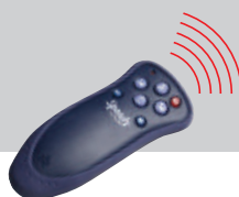
În fotografie: Calorifer Immagina cu lumina.

Immagina cu lumina reprezintă îmbinarea ideală dintre designul artistic și diverse efecte cromatice; telecomanda cu raze infraroșii permite alegerea culori dorite dintr-o vastă gamă disponibilă.