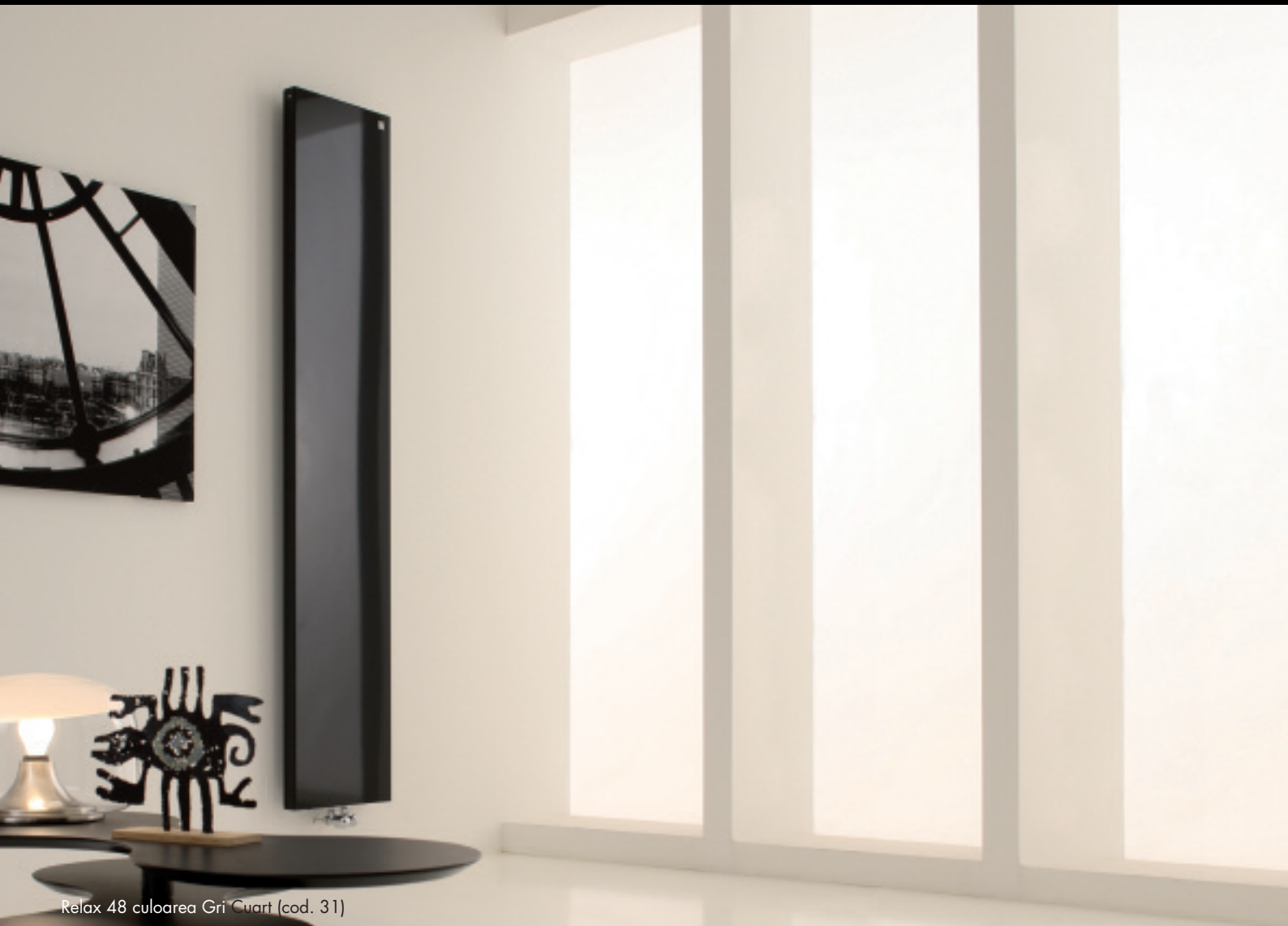
Relax 48 culoarea Gri Quart (cod. 31)