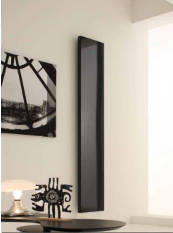
În fotografie: Calorifer Relax 48. Înălțime mm 2043, lățime mm 392, culoare Gri Cuarț (cod. 31).