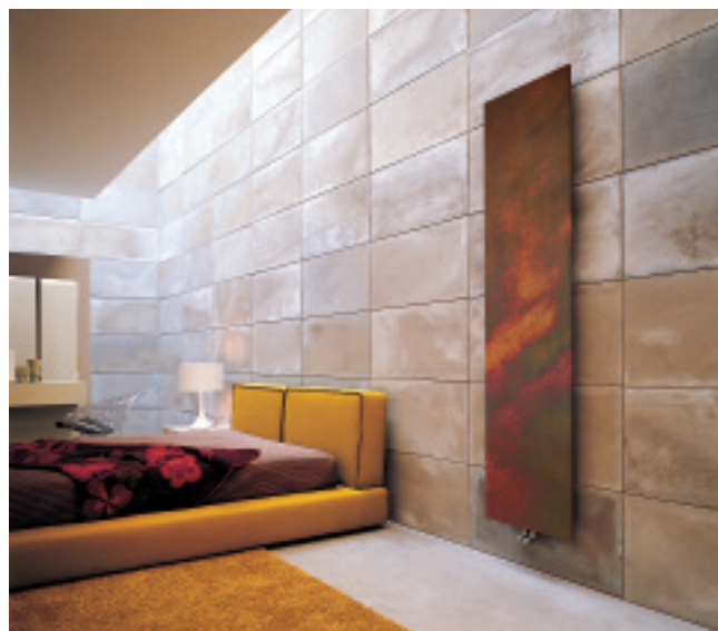
Calorifer finisaj cupru nuanțat (cod. 3B)

Relax este expresia unui design rafinat și esențial. Linia sa rectangulară și ampla gamă de culori îl fac să devină un element sugestiv de decor care se înscrie discret în orice tip de încăpere, oricare ar fi stilul de amenajare al acesteia.